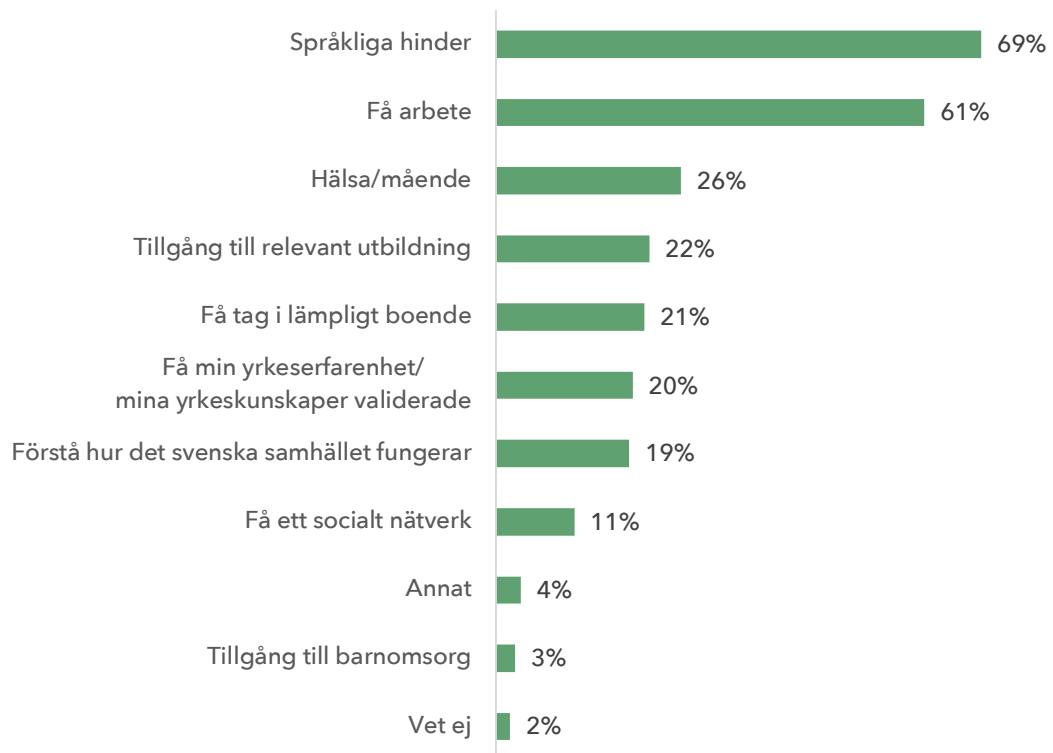
Figur 1 - Vilka är de största hindren för etablering i Sverige?

Not: Antal respondenter: 838, antal valda svar: 2 168. Frågan som ställdes var "Sedan du kom till Sverige, vad har de största utmaningarna för att etablera dig här handlat om?". Flera svarsalternativ var möjliga.