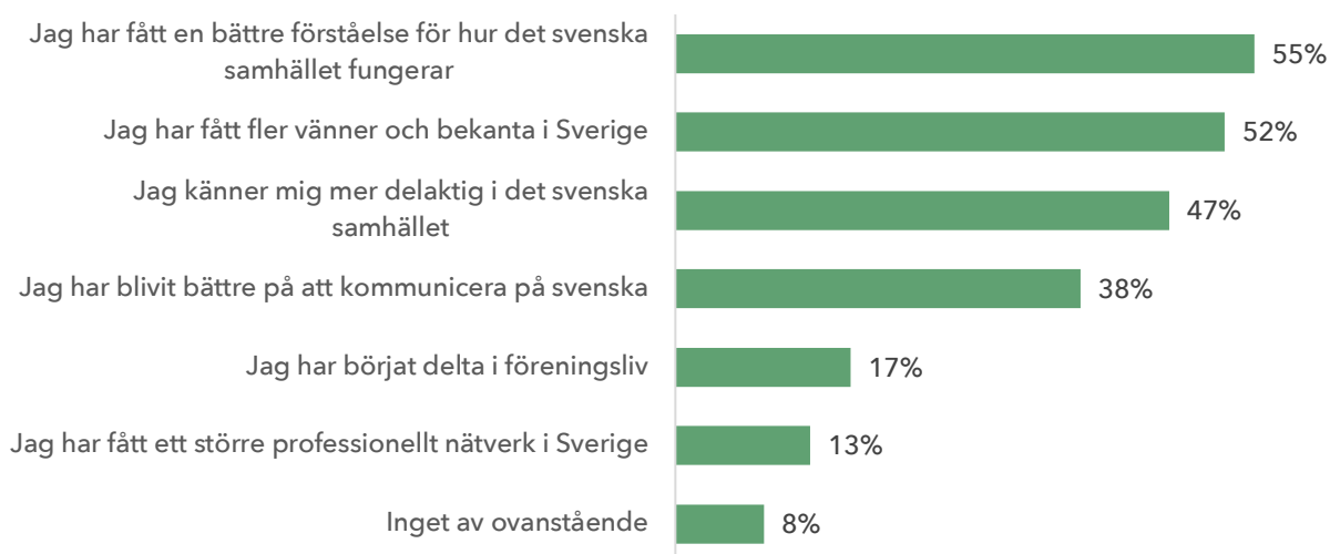
Figur 4 - Deltagares upplevelse av vad projektdeltagandet gett dem

Not: Antal respondenter: 838, antal valda svar: 1 927. Frågan som ställdes var "Vad om något har du fått ut av ditt deltagande i projektet?". Flera svarsalternativ var möjliga.