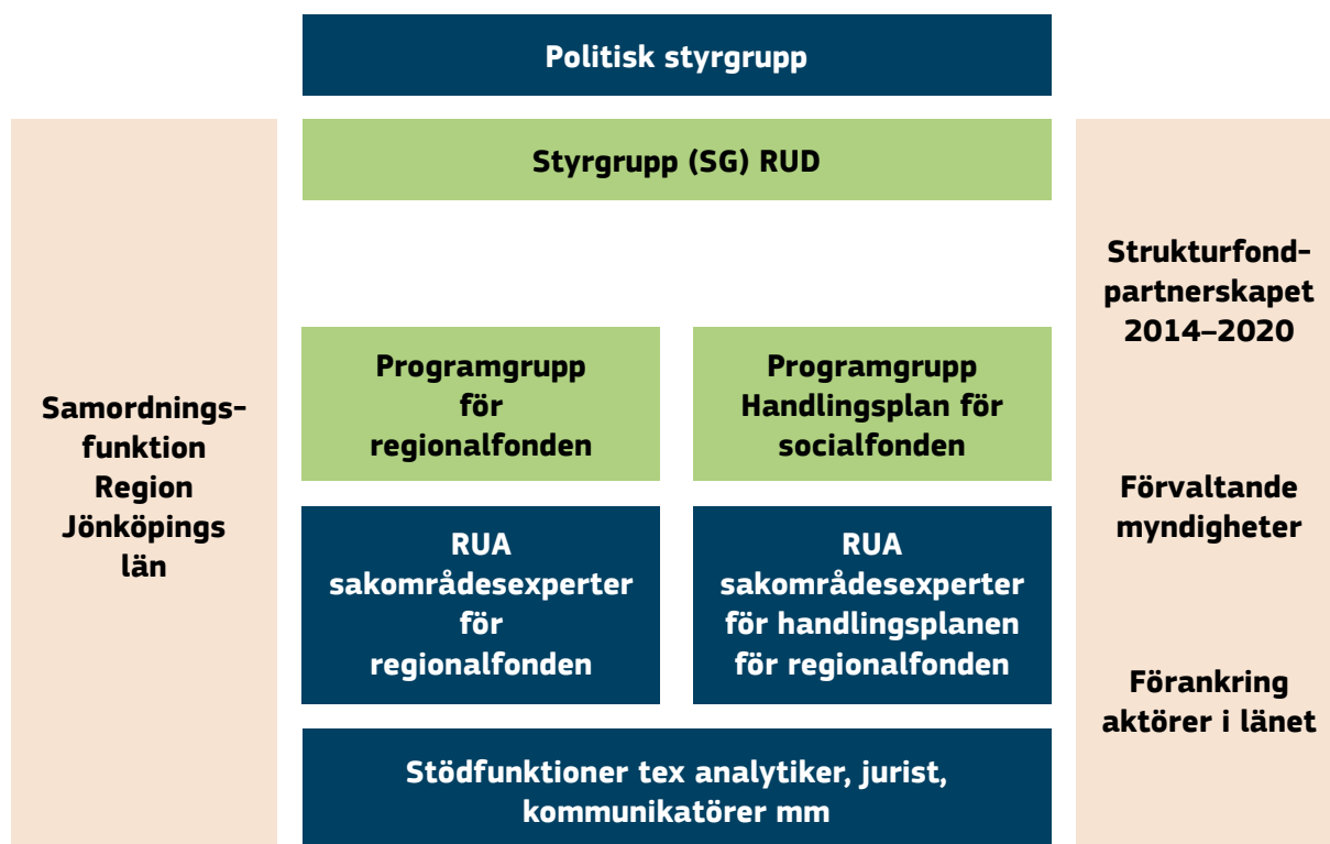
Bild över organiseringen för programarbetet i Småland och Öarna

En politisk styrgrupp har satts samman med tre politiska representanter från varje län samt ordförande för strukturfondspartnerskapet. Det finns även en styrgrupp med de fyra regionala utvecklingsdirektörerna. Det har även funnits en programgrupp med representanter från de fyra länen. Programgruppen har bestått av samma konstellation för arbetet med ESF+ och för ERUF. Programgruppen inledde sitt arbete våren 2020 och har sedan dess, med några kortare perioder som undantag, arbetat tillsammans en halvdag varannan vecka. Vid perioder av mer intensivt arbete har ytterligare arbetsmöten genomförts. Till denna programgrupp har också representant från Svenska ESF-rådet, Tillväxtverket och strukturfondspartnerskapets sekreterare adjungerats.